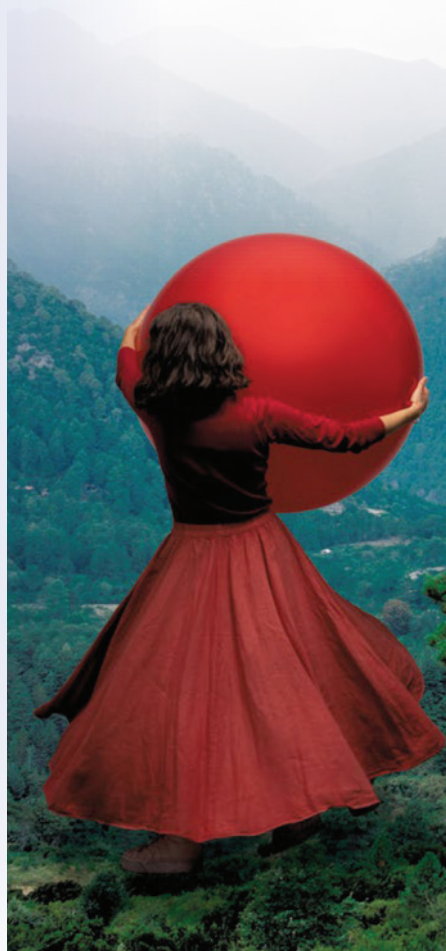
Belleville 2023

BRAHMS Josef STRAUSS Johann STRAUSS Valses, polkas et autres surprises